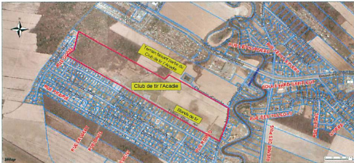
Figure 1 Localisation du Club de tir l'Acadie et des secteurs résidentiels environnants (plan fourni par la municipalité de Saint-Jean-sur-Richelieu)

Dans un document du nom acoustique des champs de tir (1) page 30 de la Gendarmerie Royale du Canada, il est écrit qu'une zone tampon de 1 à 3 Km selon la topographie du sol est exigée entre un champ de tir extérieur et les habitations afin de contrer la nuisance par le bruit. Selon l'étude de INGAC consultants en acoustique du bâtiment et bruit environnemental, un champ de tir intérieur est la seule solution qui règlera le problème de nuisance par le bruit dans tous ces secteurs.